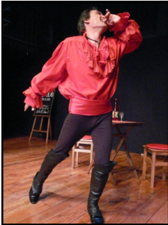
Pleins Feux sur Ruy Blas

Dans votre lycée, proposons ensemble un rendez-vous avec Victor HUGO et/ou Paul VERLAINE une recherche sur la langue et sur la pensée, une sensibilisation par la rime, par le son !