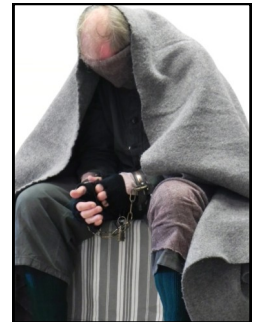
Verlaine en Mots Dits

Depuis cinq ans, la Cie Furieux du Jeu Dit présente à l'adresse des candidats au Bac de Français la collection Lettres & le Savoir : une série de spectacles, des jeux dits précisément dédiés aux objets d'étude.